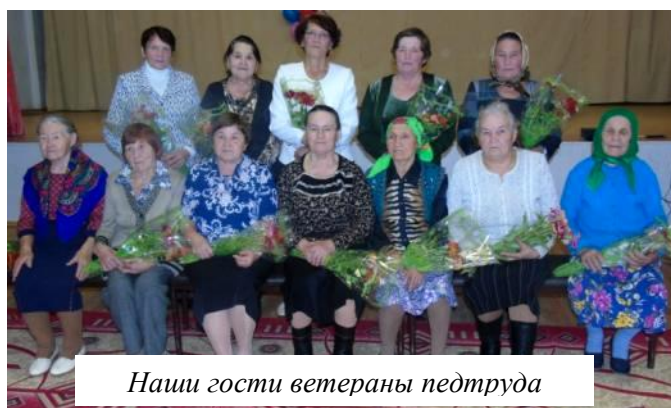
Наши гости ветераны педтруда

По сложившейся традиции в День учителя проводится день самоуправления, чтобы дети на себе могли ощутить все сложности и радости учительского труда. Праздник начался с линейки, на которой новоиспечённая администрация зачитала приказ и ознакомила учащихся с новыми учителями. Праздничный день завершён прекрасным концертом.